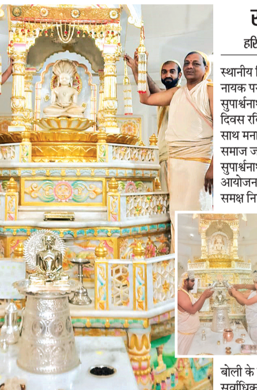
बोली के माध्यम से हुआ। जिसमें सर्वाधिक बोली लगाकर कलश