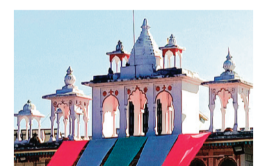
ललितपुर।

श्री 1008 शान्तिनाथ दिगम्बर जैन सतदय तीर्थ क्षेत्र, सेरेन जी में आगामी 4 मार्च से 8 मार्च तक आयोजित होने वाले श्रीपंचकल्याणक प्रतिष्ठा समारोह एवं गजरथ महामहोत्सव की तैयारियां जोर-शोर से चल रही हैं। यह भव्य धार्मिक आयोजन समाधि सम्राट आचार्य श्रीविद्यासागर महाराज एवं