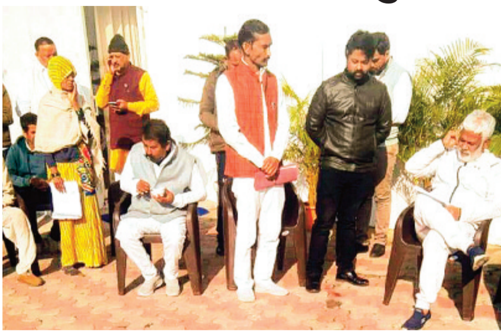
हरिभूमि न्यूज | ललितपुर

भौट बांध परियोजना से विस्थापित किसानों और ग्रामीणों ने परिसंपत्तियों का समुचित मुआवजा न मिलने से निराश होकर मुख्यमंत्री जनता दरबार में गुहार लगाई है। विस्थापितों ने न केवल लंबित